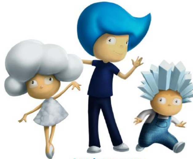
Los hermanos Glup-Glup