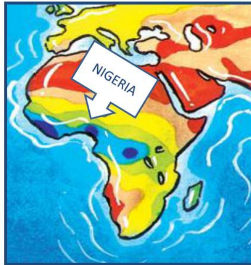
Mapa de precipitaciones anuales